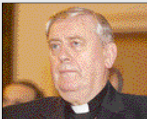
Bischof Ludwig Schwarz: Arme nicht im Stich lassen. fjr/A

Der Vorsitzende der Koordinierungsstelle für Mission und Entwicklung, Bischof Ludwig Schwarz, appellierte an die Mächtigen der Welt und die österreichische Regierung, sich für die Umset-